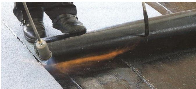
Natavování s navijčem rolí