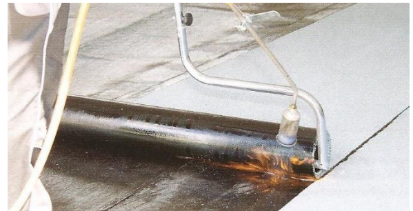
Variantní natavování rozbalovačem rolí