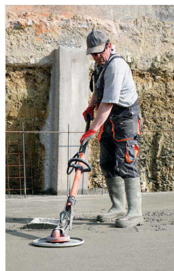
Vyrovnání betonových ploch