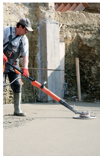
Práce šetrná k zádům