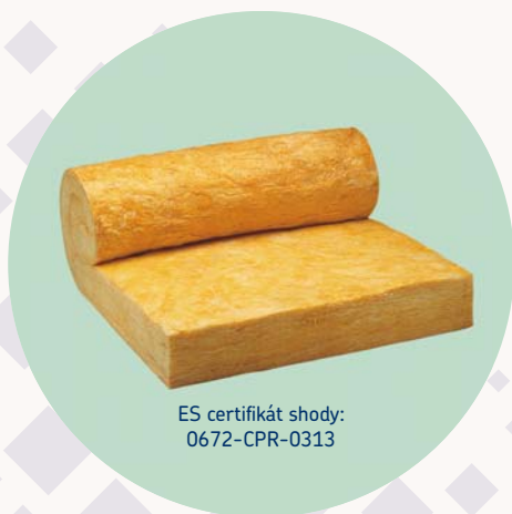
ES certifikát shody: 0672-CPR-0313